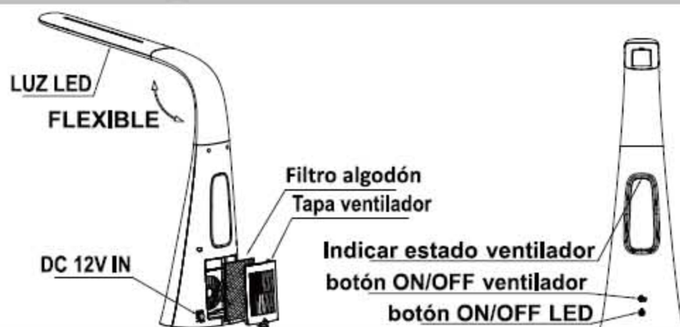
Ilustración del producto